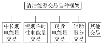
图1 清洁能源交易品种框架